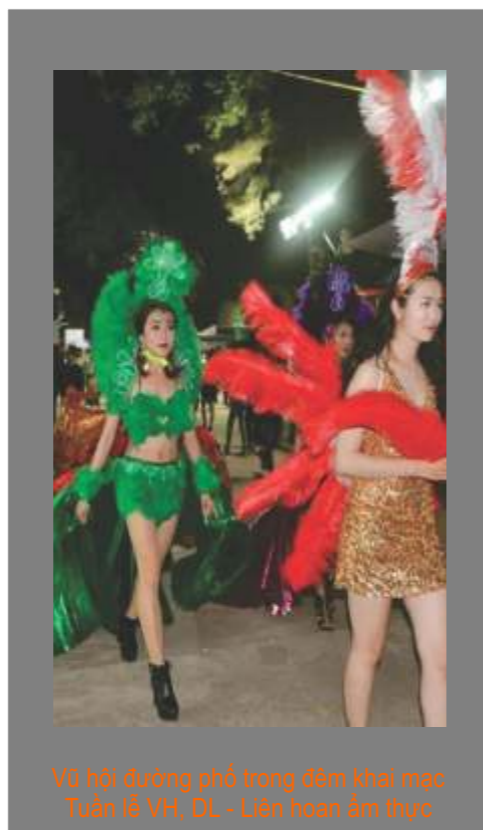
Vũ hội đường phố trong đêm khai mạc Tuần lễ VH, DL - Liên hoan ẩm thực

- Đơn vị thực hiện: Sở Văn hóa, Thể thao và Du lịch Trà Vinh phối hợp Đài PTTH tỉnh, UBND thành phố Trà Vinh và Công ty tổ chức sự kiện.