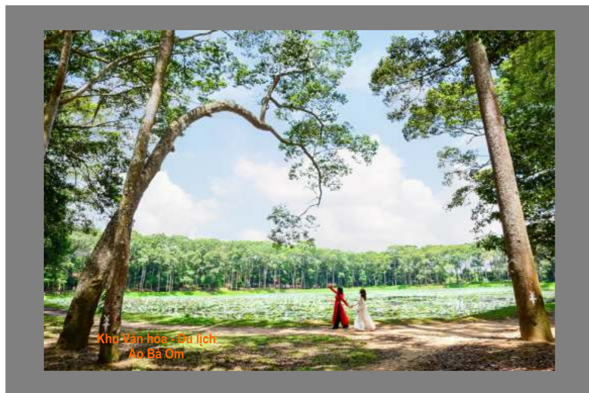
Khu Văn hóa - Du lịch Ao Bà Om